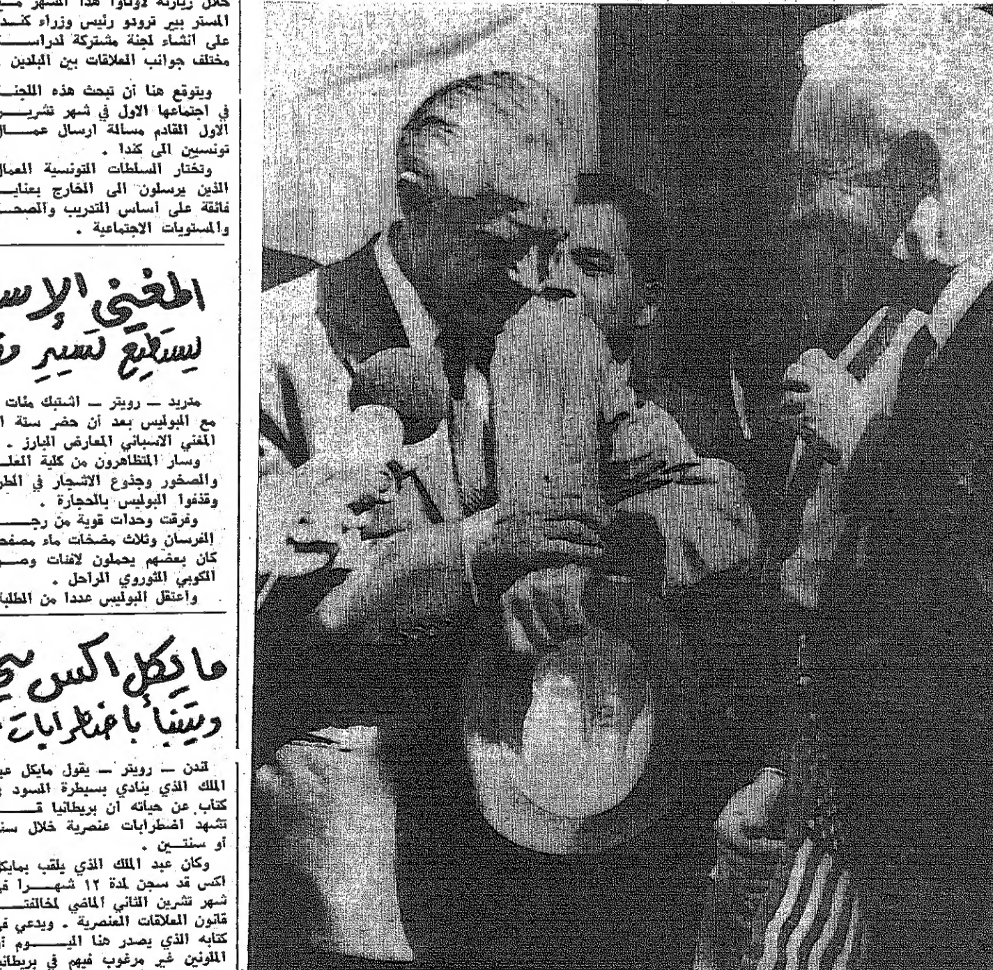
المستر اغريل هاريمان رئيس الوفد الاجري الى محادثات السلام الفلسطينية يراجع الوقت اثناء حديثه مع الصحفيين وهو في طريقه الى مركز المؤتمرات الدولي في باريس للاجتماع بجنوبي في تمام الشمالية

أيام - وكان هذا التبريق الدفعة الاولى من ٢٢ شخصا طرقتهم السلطات الاوروبية التي يزعمها العدد المتزايد من الهيبين والانتطاع الذي يتركه في البلاد بسبب اختلاف مظهرهم وتخيبيهم الماريجوانا . وقال هؤلاء الهيبون وحيث لهم مع المصحفين بعد ان طغوا مسافة سبعمائة كيلومتر من الحدود التي يتركها ان موظفي الحدود الماريجوانيين اصروا على خلق لحام ونص شعهم قبل ان يتخوم سمة تحتها سبعمائة كيلومتر .